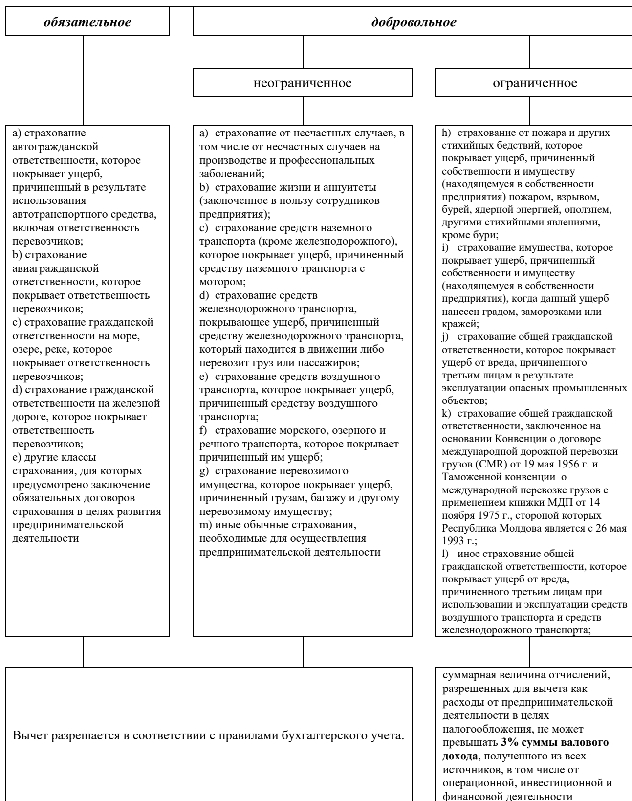
Рисунок 2. Правила вычета расходов на страхование

Более того, для заключения видов страхования, субсидируемых государством, величина отчислений, разрешенных для вычета как расходы от предпринимательской деятельности в целях налогообложения, не может превышать долю страховой премии, которая подлежит к уплате страхователем (сельскохозяйственное предприятие, сельскохозяйственный производитель) согласно соответствующим специальным законам.